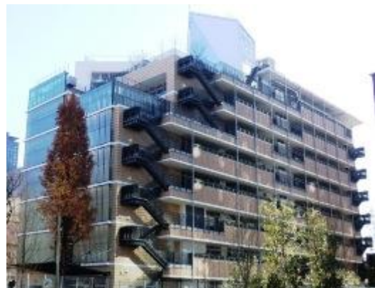
みなと保健所