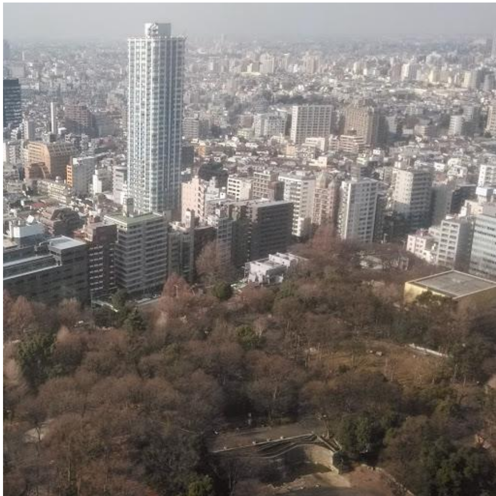
都庁第一本庁舎から見た新宿中央公園