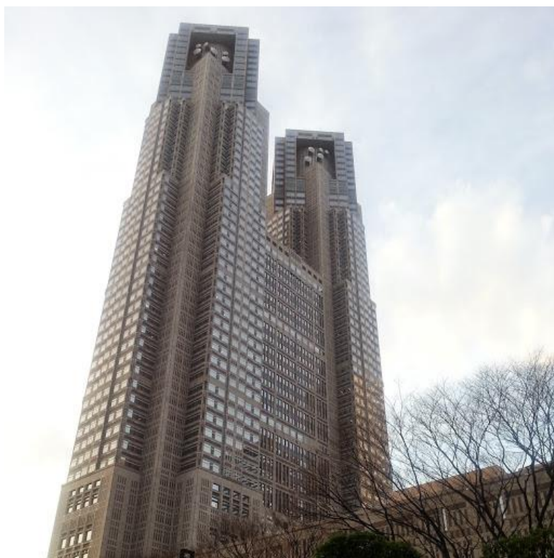
東京都庁第一本庁舎