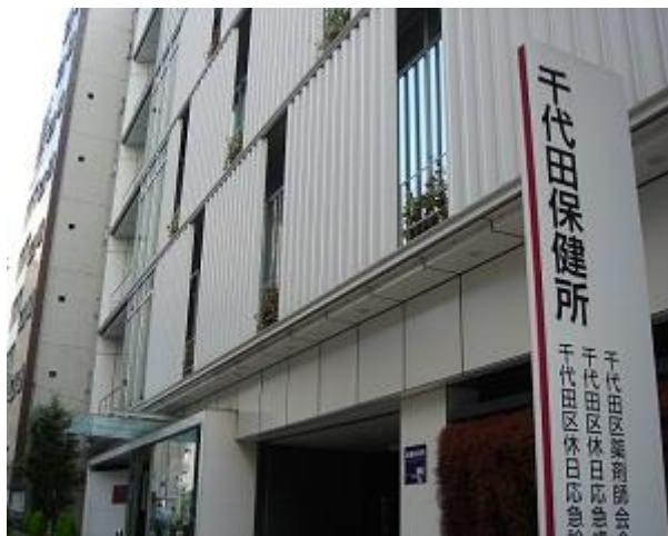
千代田保健所