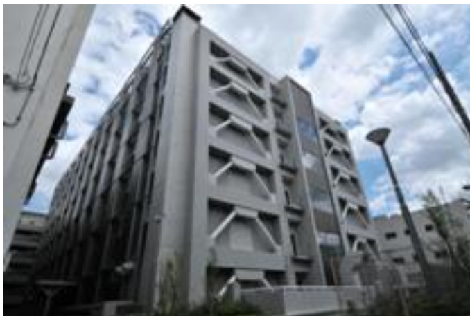
東京都健康安全研究センター（新宿区百人町）