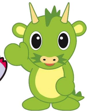
さいたま市マスコット「ヌウ」